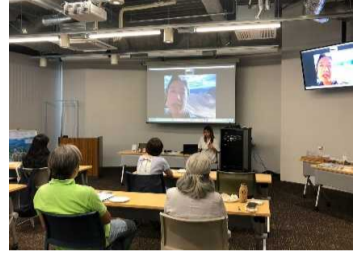
奈良まほろば館での店頭販売、セミナーの様子