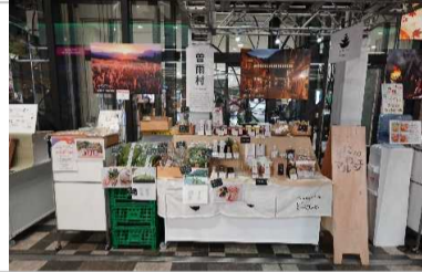
あべのハルクス近鉄本店にてイベント販売