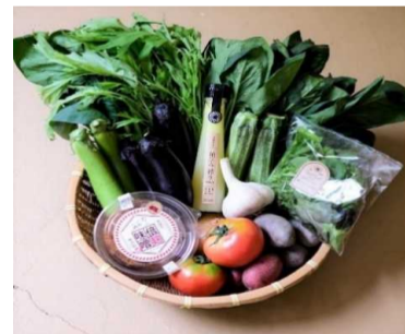
そののわマルシェ定期便