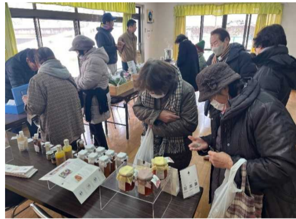
出張そこのわマルシェの様子