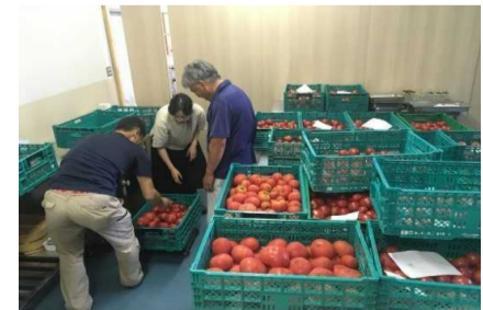
規格外トマトの買い取り・販売事業