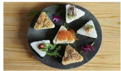
セトレならまちで宿泊客に毎朝提供されている曾爾米のおにぎり