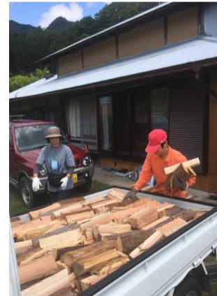
薪ストーブ用 (村内外の家庭)