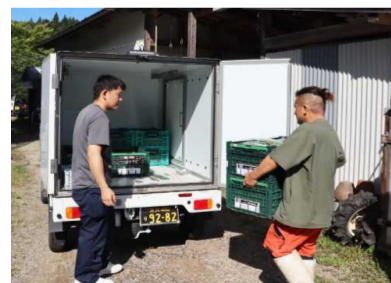
共同配送便事業(積み込みの様子)