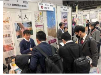
FOOD STAYLE関西に出展。多くのバイヤーとの商談から今後への繋がりが生まれました。