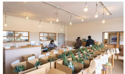
野菜の箱詰め作業風景(そののわの台所katte)